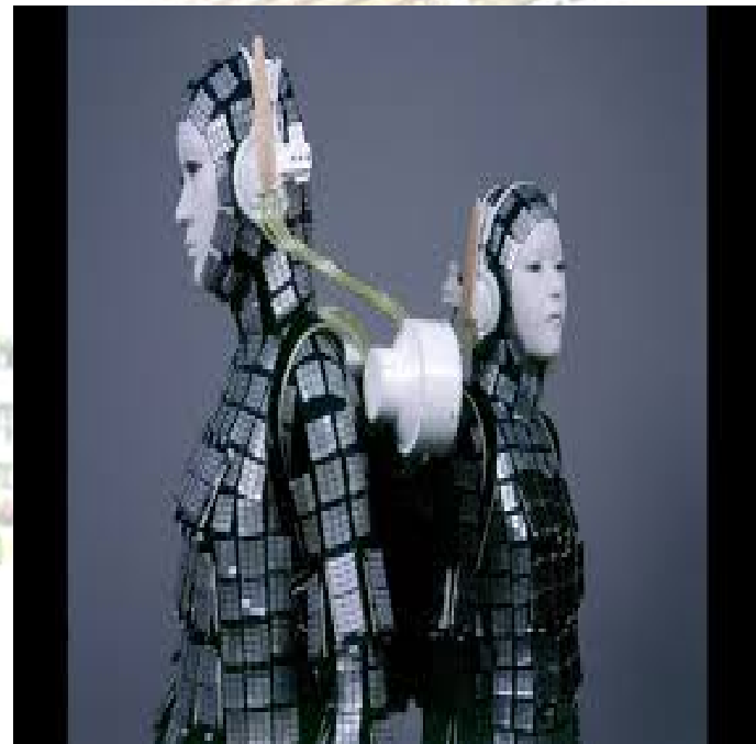
圖三、賽伯格示意圖