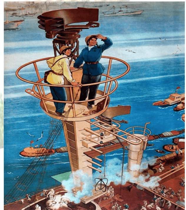
圖四、年輕人的懷舊