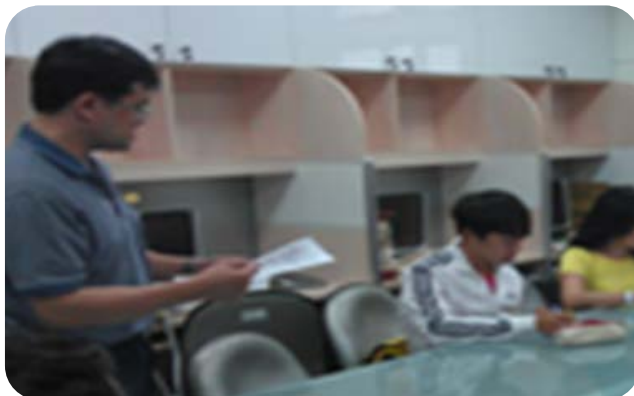
教學實務研究成果發表