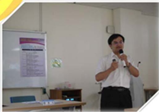
教學實務研究成果發表